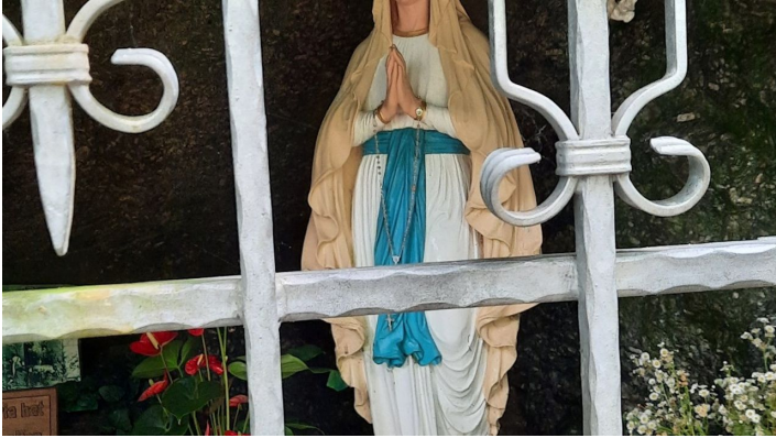
Mariengrotte 2