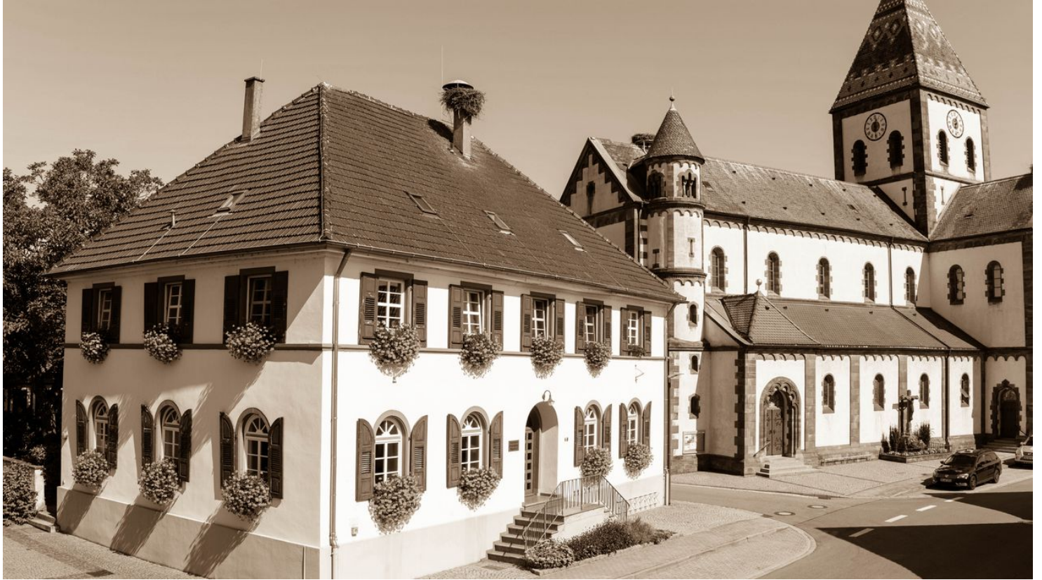
Rathaus und Kirche