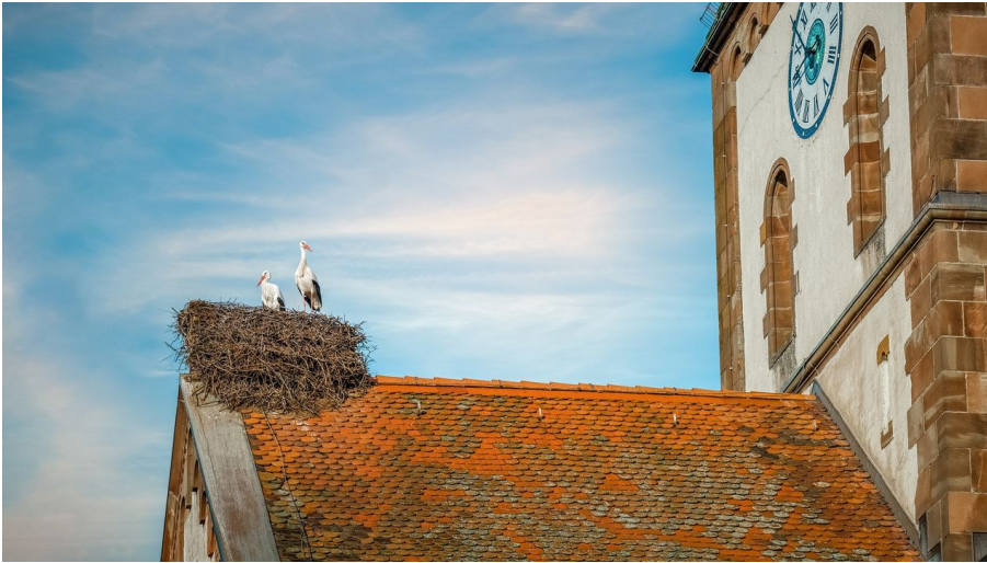
Wagshurst Kirche mit Storch