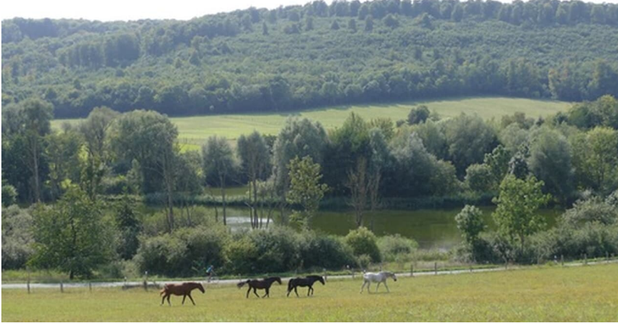
Reitlingstal_c_Geopark_HBLO_J_Trentlage.jpg - © © Geopark HBLO/J. Trentlage