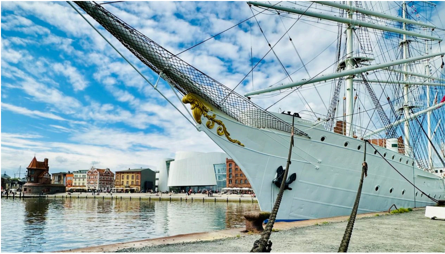
Gorch Fock I