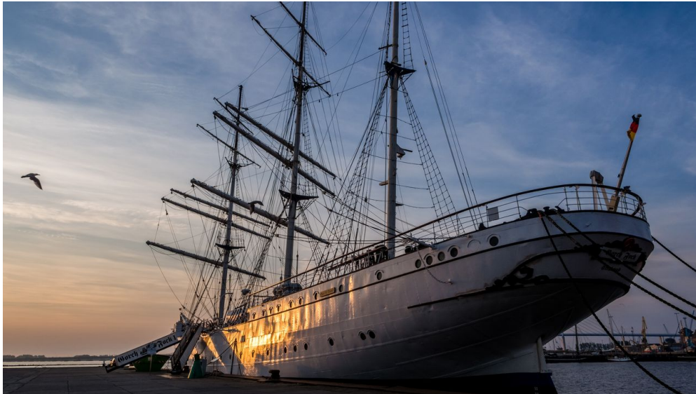
Gorch Fock I Abendstimmung