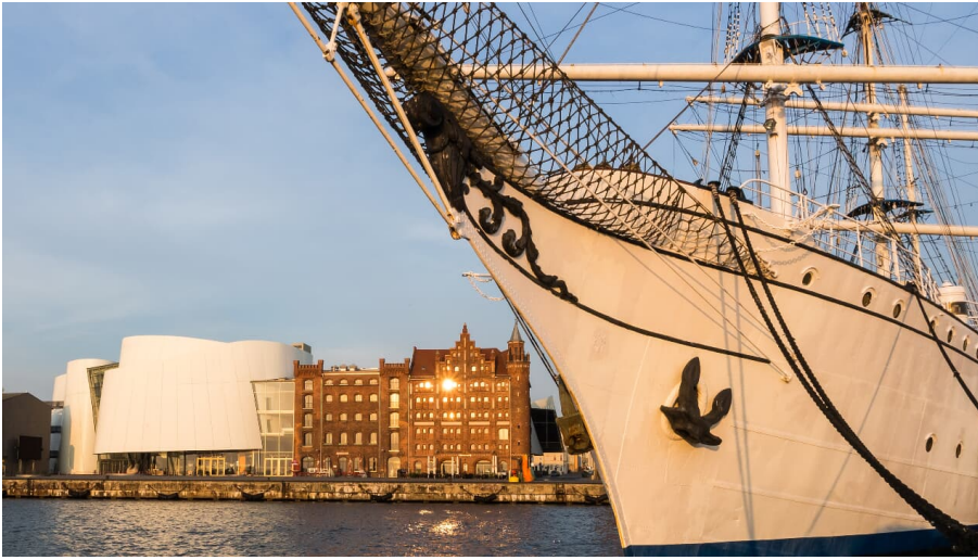
Gorch Fock I vor Hafenkulisse