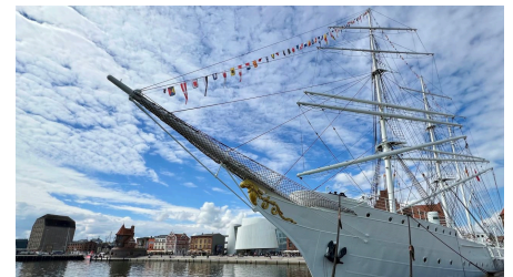
Gorch Fock I