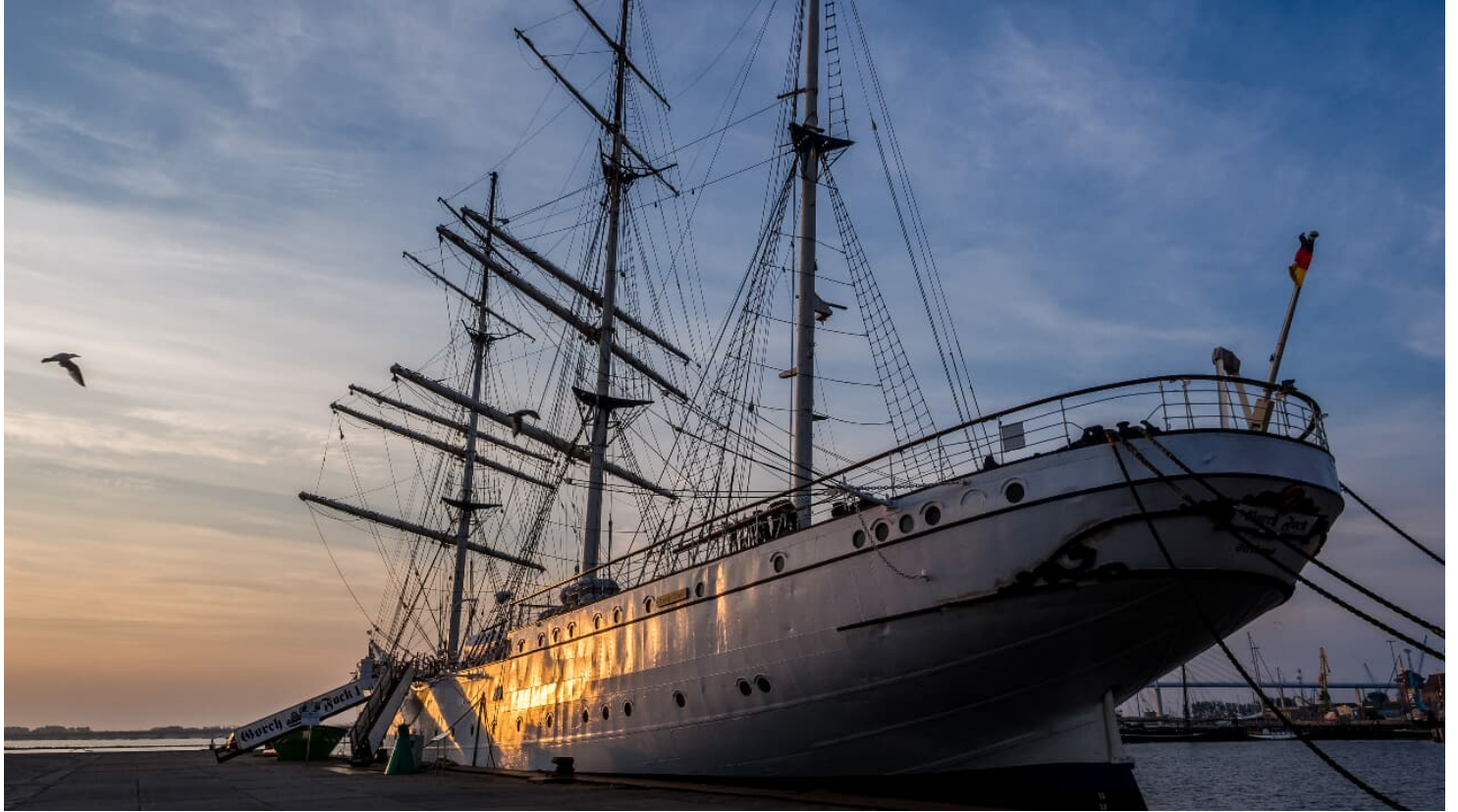
Gorch Fock I Abendstimmung