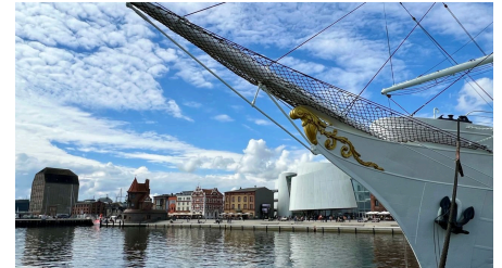
Gorch Fock I