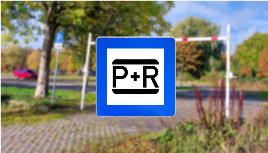
P+R Schwarze Kuppe