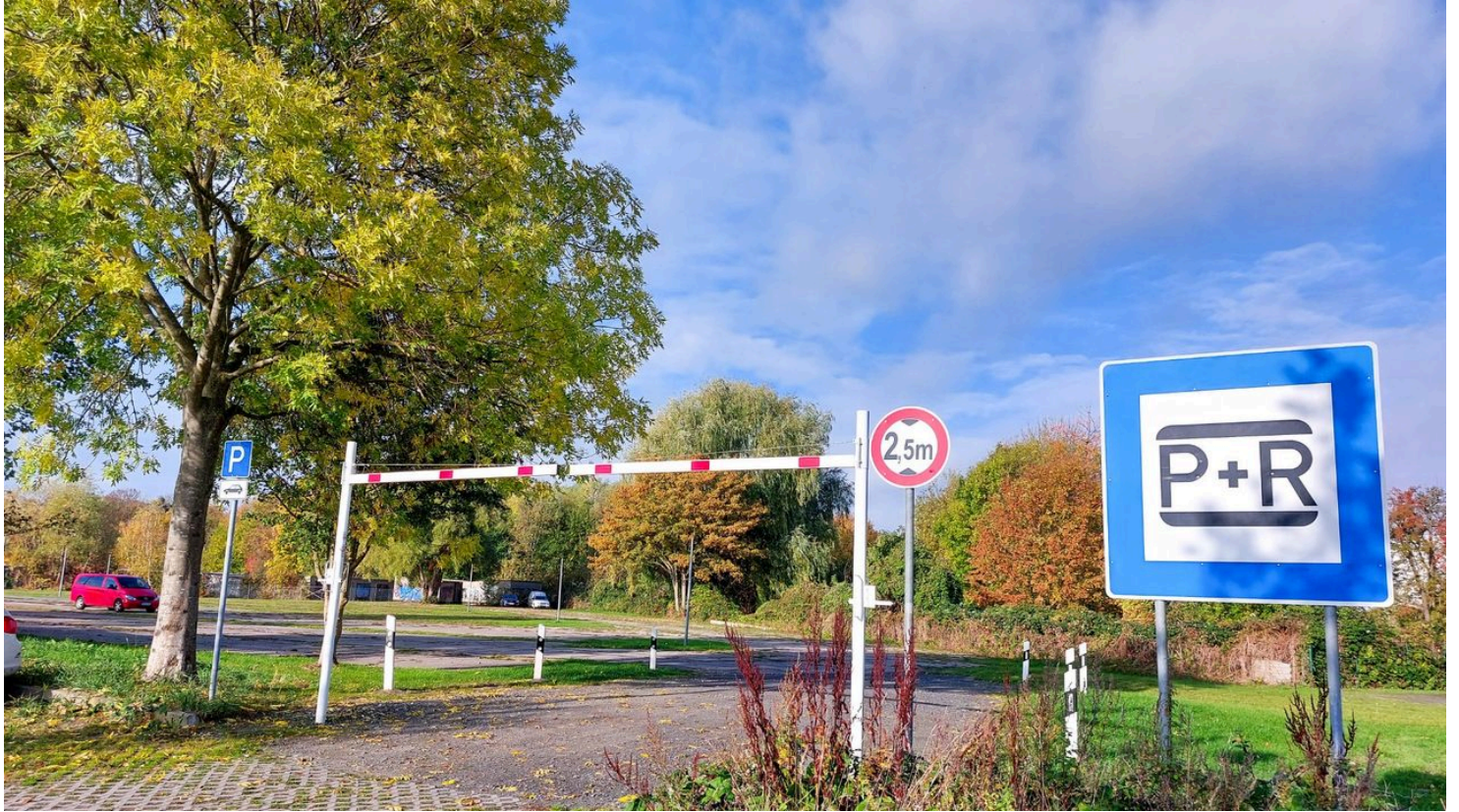
P+R Schwarze Kuppe