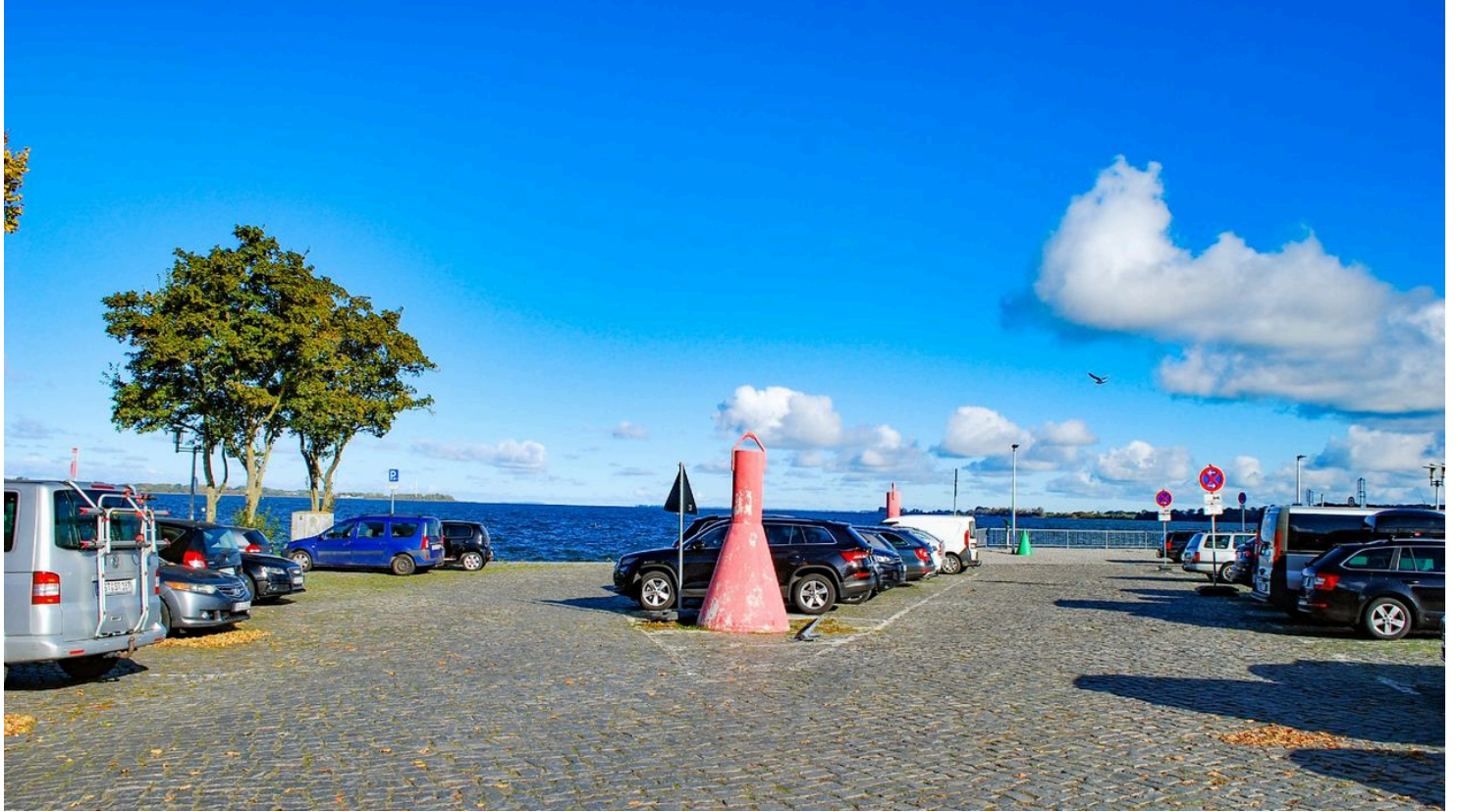
Parkplatz Seestraße an der Mole