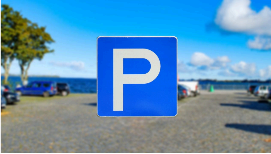
Parkplatz Seestraße an der Mole