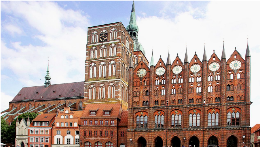
Rathaus und Nikolaikirche Stralsund