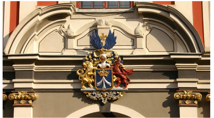
Rathaus Wappen