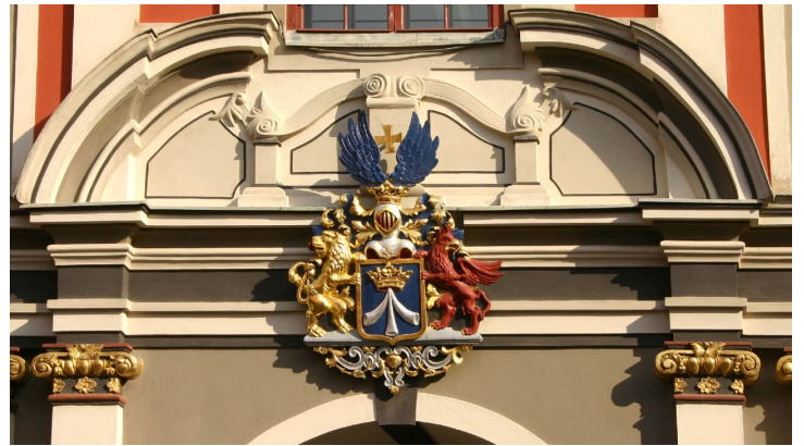
Rathaus Wappen