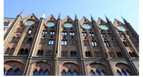
Rathaus Stralsund