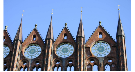
Rathaus Stralsund