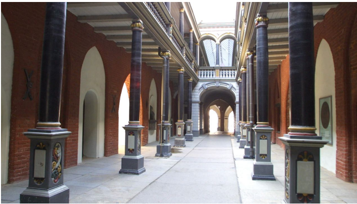
Rathaus Durchgang