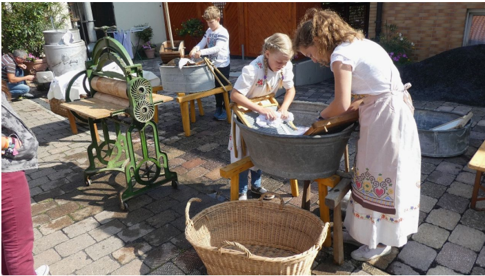
Lebendiges Museum Odershausen -3-

Geöffnet von Mai bis Oktober jeweils am 3. Sonntag im Monat, im November aber schon am 1. oder 2. Sonntag. Jeder dieser Aktions-Sonntage steht unter einem besonderen, der aktuellen Jahreszeit angepassten Motto. Gezeigt werden viele Aktivitäten, deren Endprodukte dann auch oft direkt vor Ort verspeist werden können.