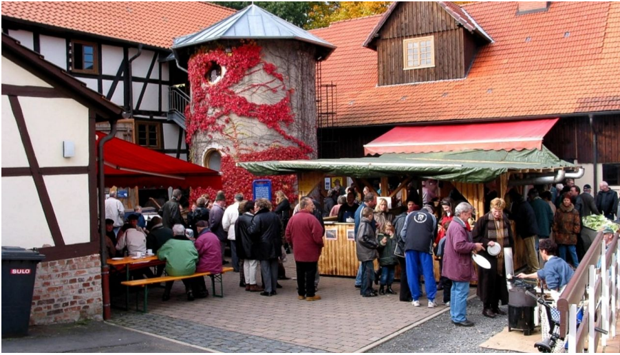
Lebendiges Museum Odershausen -1 - © Staatsbad