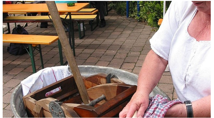
Lebendiges Museum Odershausen -2-