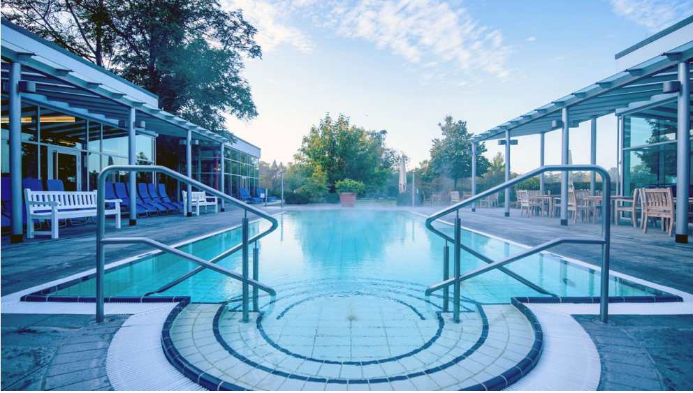
Thermalbad Aukammtal Außenbecken