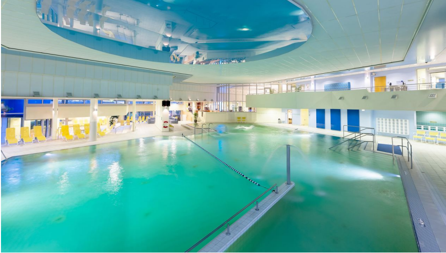
Thermalbad Aukammtal innen - © Joerg Halisch "Alle Rechte vorbehalten"