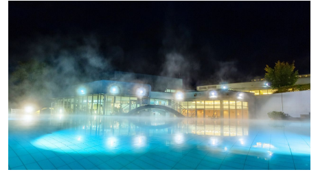
Thermalbad Aukammtal außen