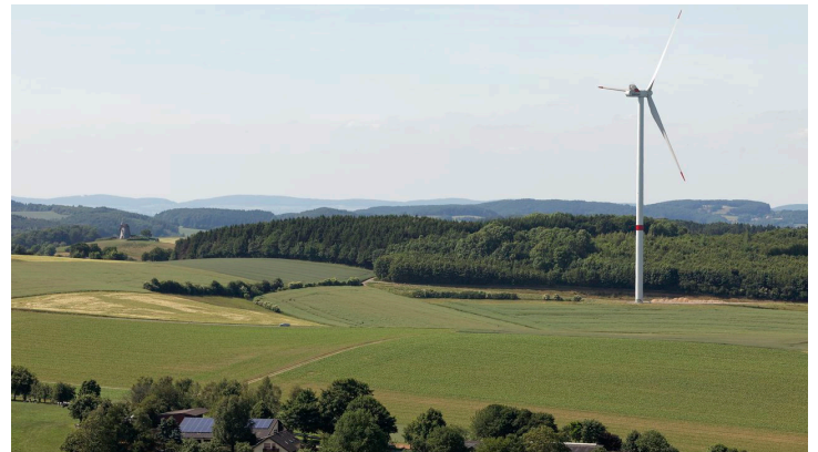
Mühle und Windrad Kleeberg