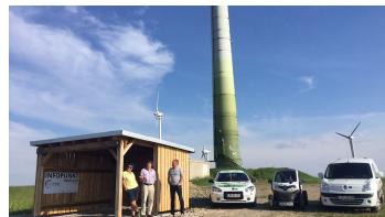
Infopunkt Windenergie CC BY-SA - LTM.JPG