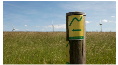
Wanderweg Kleeberg CC BY-SA - LTM.jpg