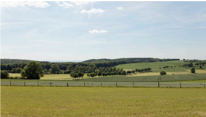
Landschaft am Kleeberg 3 CC BY-SA - LTM.jpg