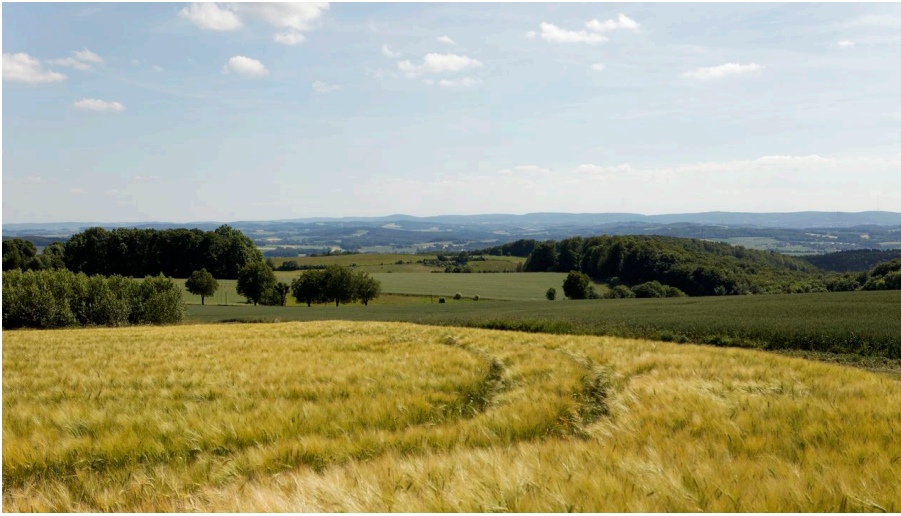
Landschaft am Kleeberg