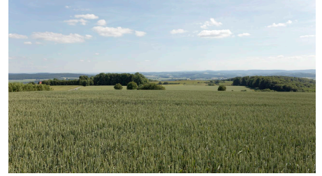
Landschaft am Kleeberg 4