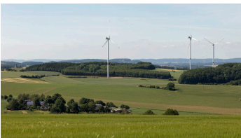
Mühle und Windräder Kleeberg