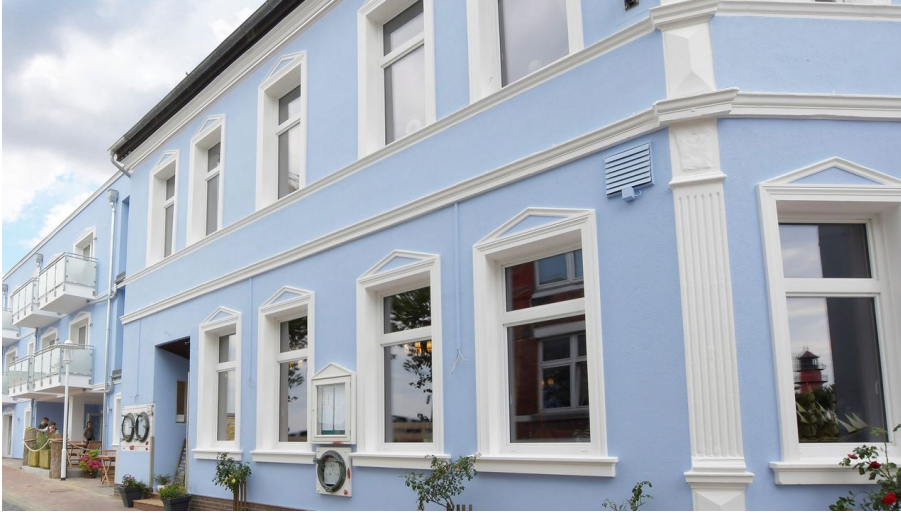
Alter Muschelsaal