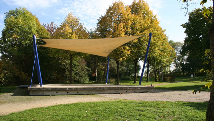
Naumburg Kneipp Kurpark Musikpavillon