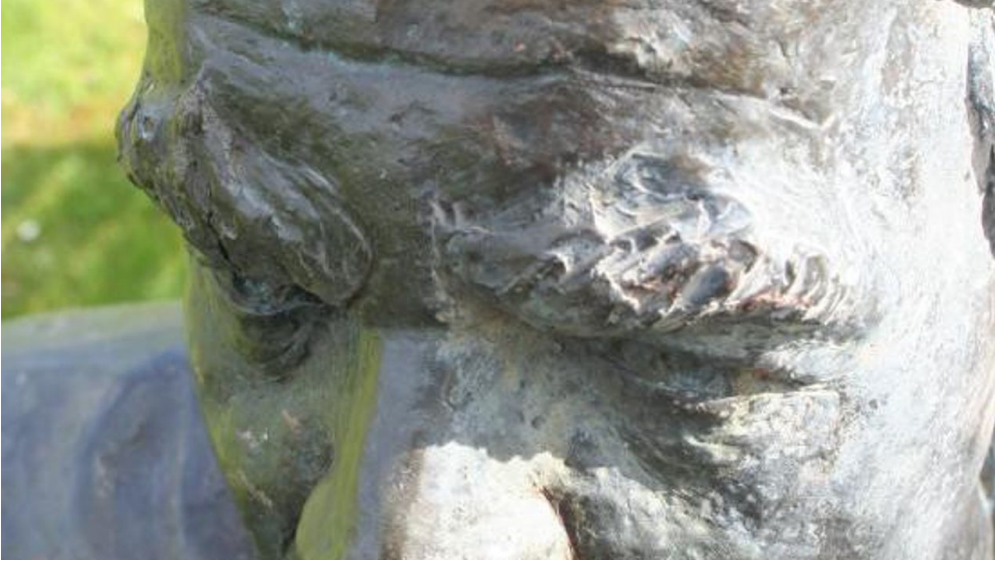
2008 Naumburg Kurpark Kneipp