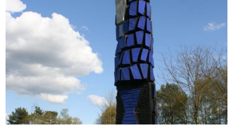
2008 Naumburg Kurpark blaue Säule