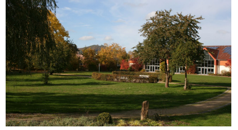
Naumburg Kneipp Kurpark Weidelsburg