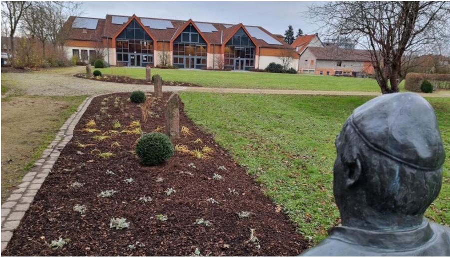
20211125 Naumburg Kurpark Kneipp