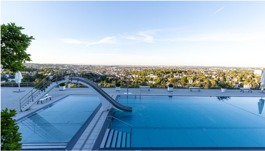
Opelbad am Neroberg - © Team Brennweite, Sebastian Stenzel