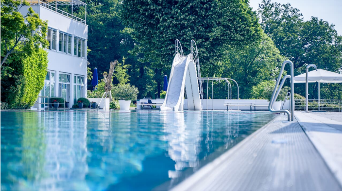
Opelbad Rutsche