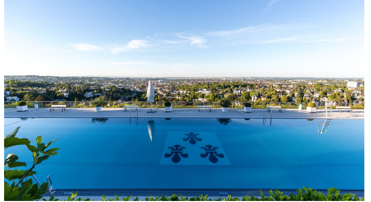
Opelbad Aussicht