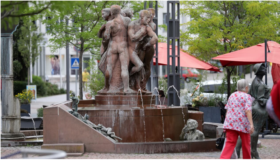
Bad Wildungen - Brunnenallee Kurschattenbrunnen