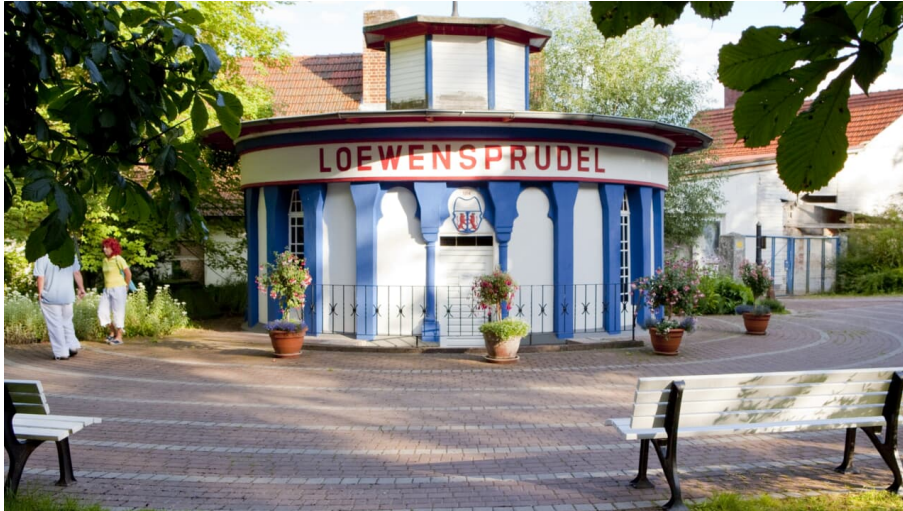
Brunnentempel im Kurpark am Löwensprudel