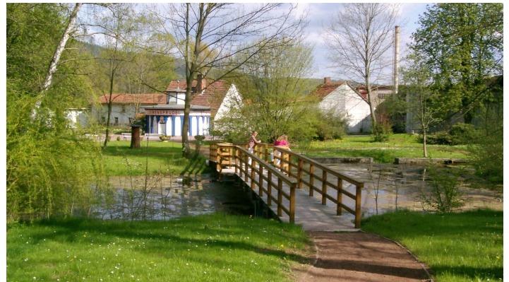
Kurpark Löwensprudel (2).JPG