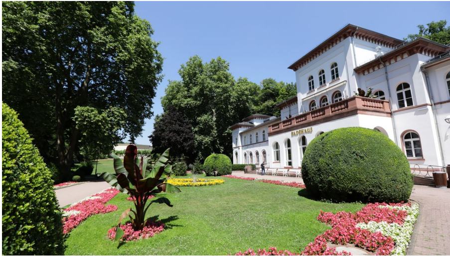
Bad Soden Badehaus