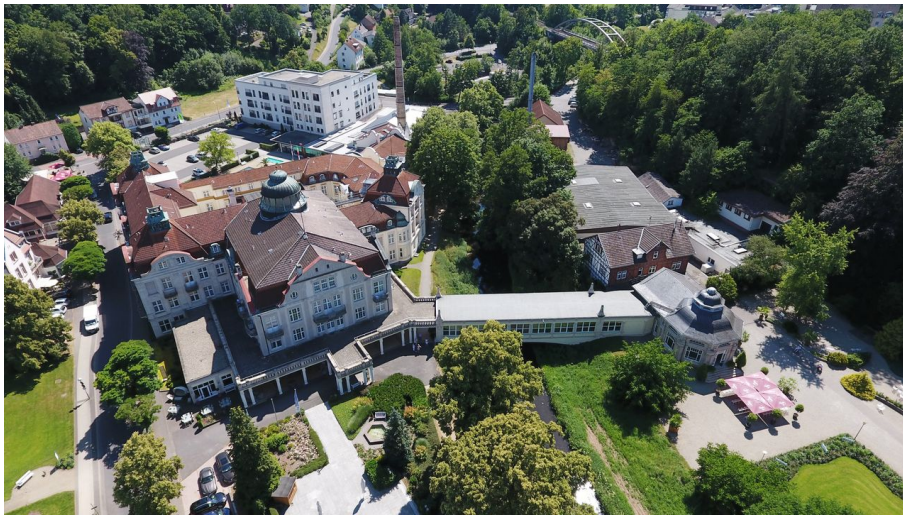
Bad Salzschlirf - Badehof von oben