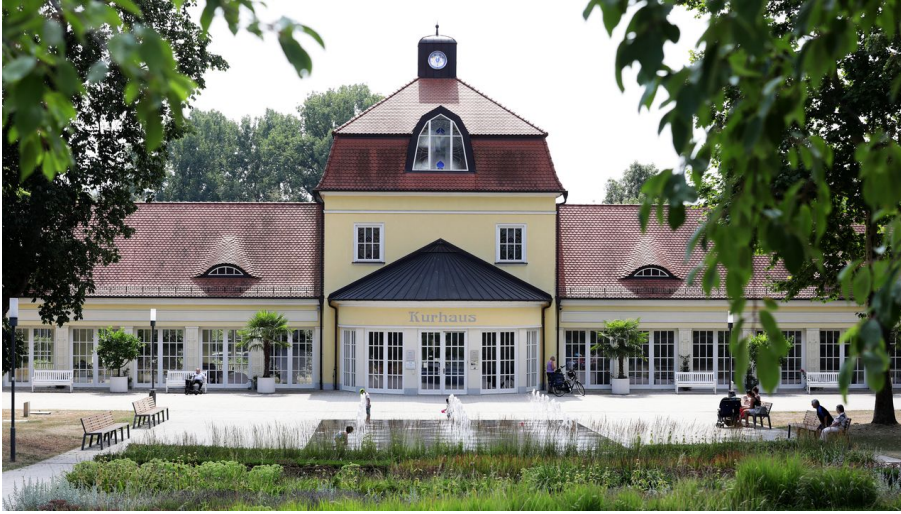
Bad Hersfeld - Kurhaus