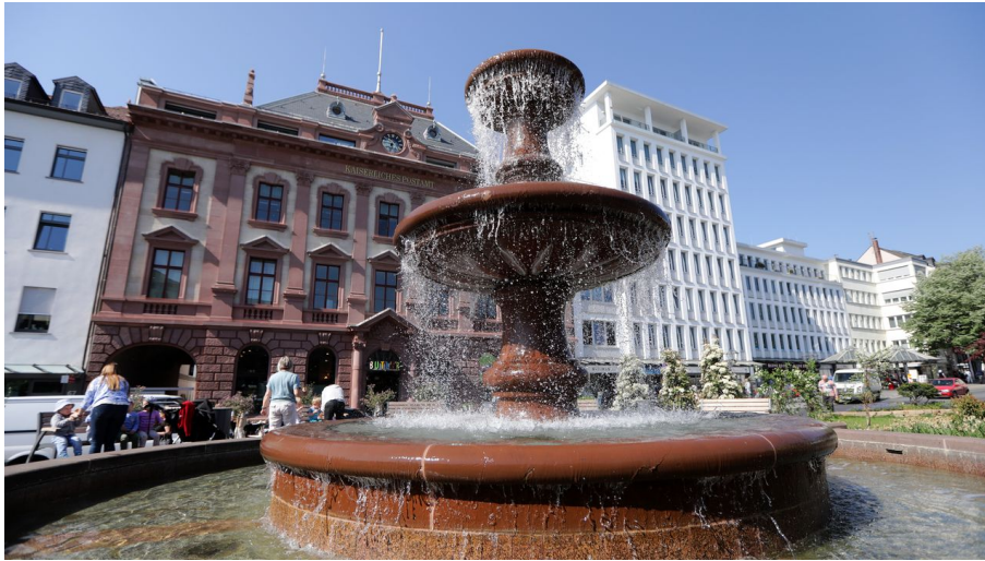
Bad Homburg - Kurhaus Brunnen