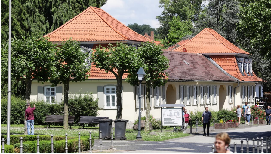
Barockhäuschen Bad Salzhausen