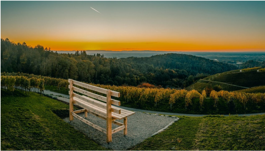
XXL Bank Waldulm