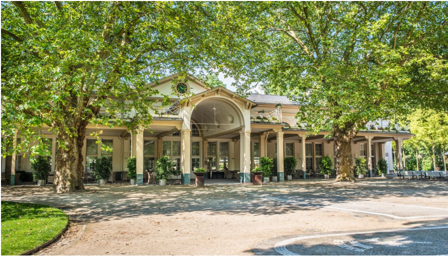
Orangerie im Kurpark Bad Homburg