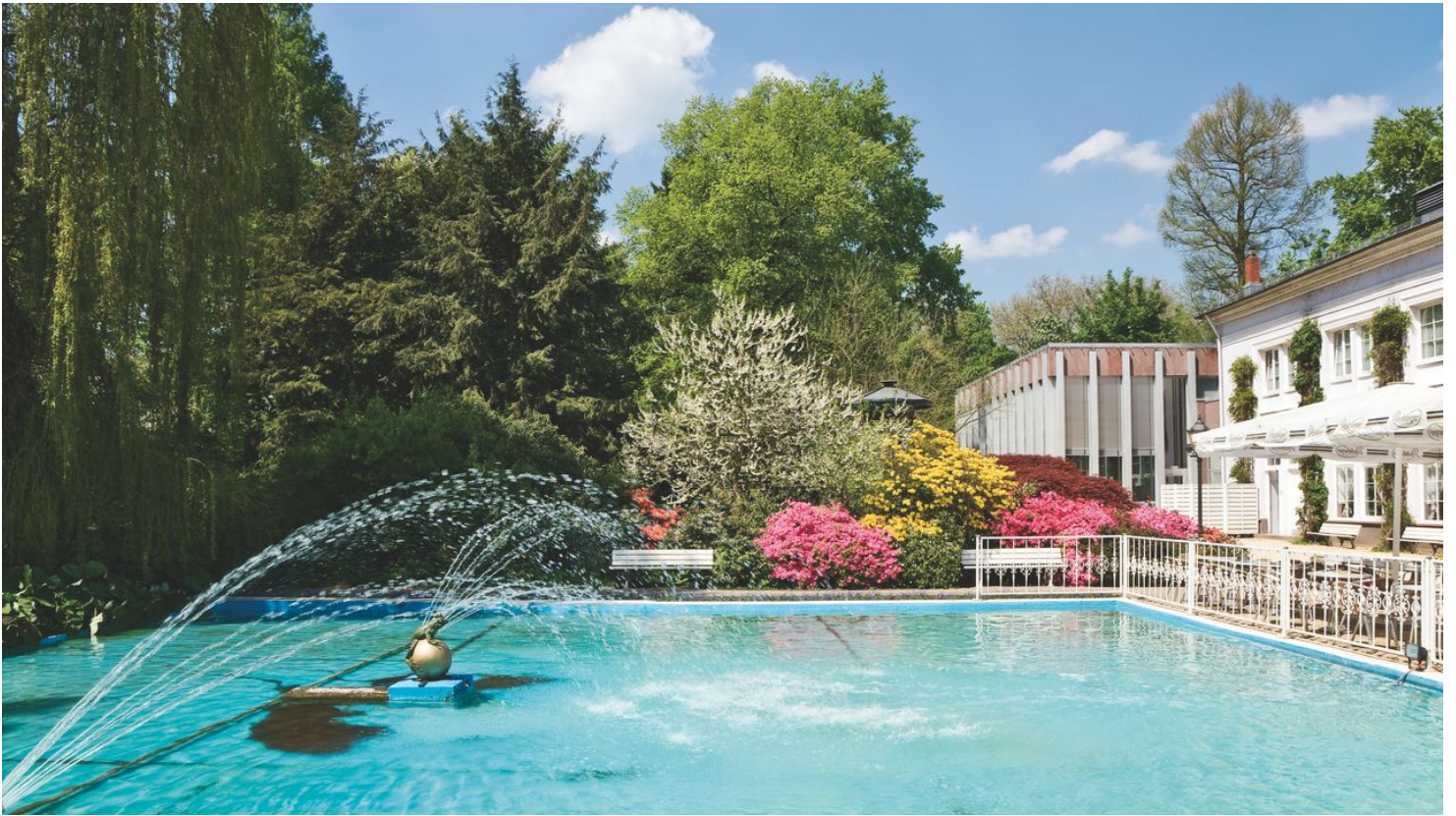
Orangerie im Kurpark Bad Homburg