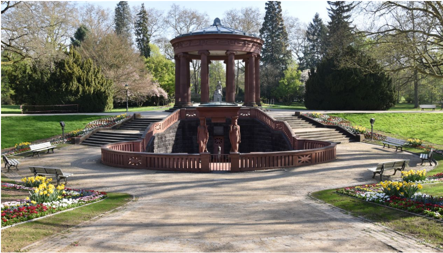
Elisabethenbrunnen_Kurpark_Frühling(58)_Bad Homburg_kuk.JPG