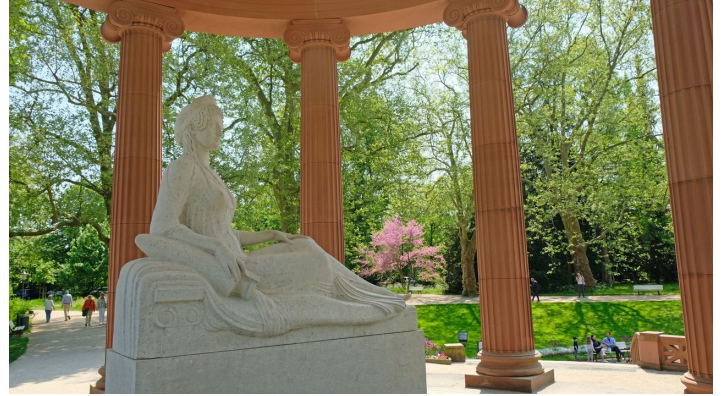
Kurpark_Elisabethenbrunnen_220508 (6)Bad Homburg_kuk.JPG