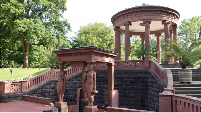
Elisabethenbrunnen_Sommer (22)_Bad Homburg_kuk.JPG