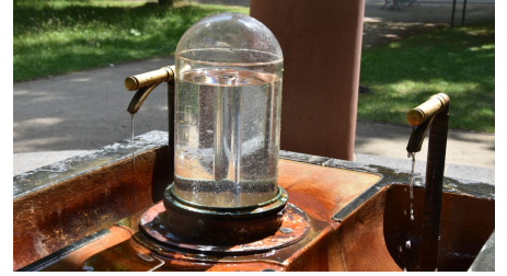
Kurpark_Auguste_Victoria_Brunnen (37)_Bad Homburg_kuk.JPG