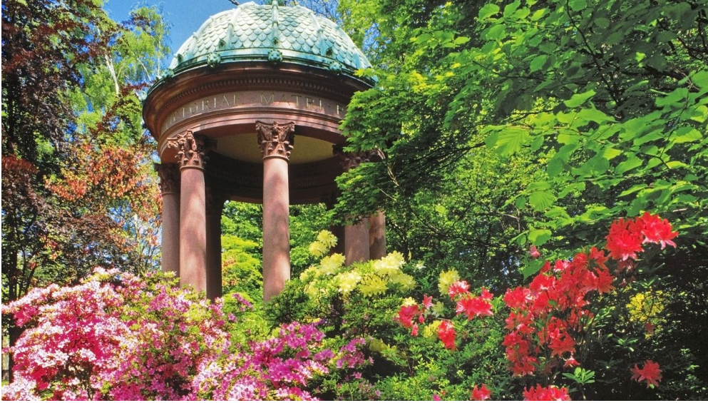
Auguste-Victoria-Brunnen_Bad Homburg_kuk.JPG