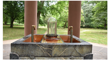
Kurpark_Auguste_Victoria_Brunnen (6)_Bad Homburg_kuk.JPG