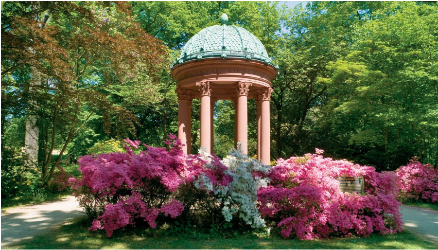
Auguste-Viktoria-Brunnen_Sommer_Bad Homburg_kuk.jpg - © Heiko Rhode