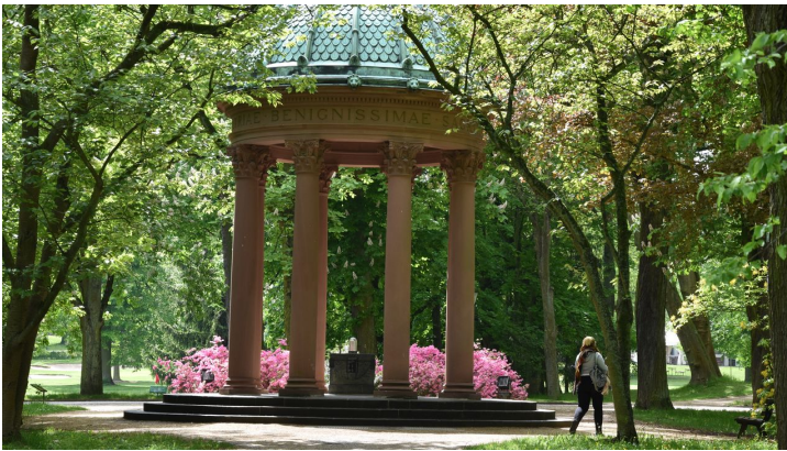
Kurpark_Brunnen(400)_Bad Homburg_kuk.JPG