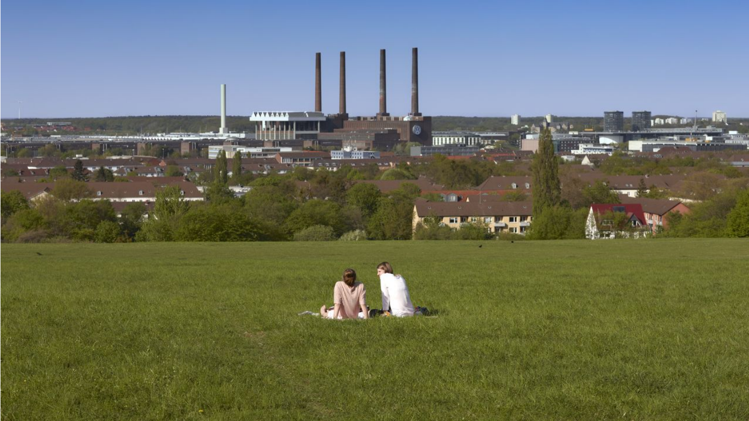
Blick vom Klieversberg