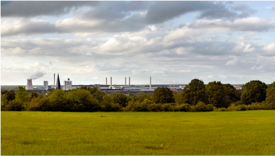
Panoramablick vom Klieversberg