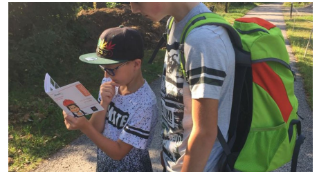
BAIE_Annis Geheimnis_1

Annis_Schwarzwaldgeheimnis_Logo