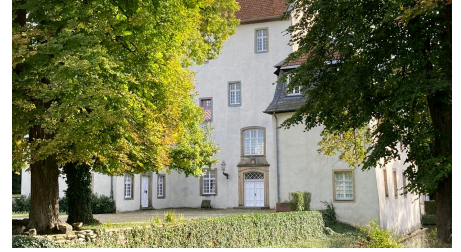
Dreckburg | Salzkotten