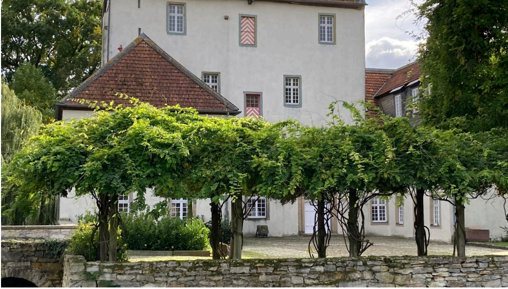
Dreckburg | Salzkotten