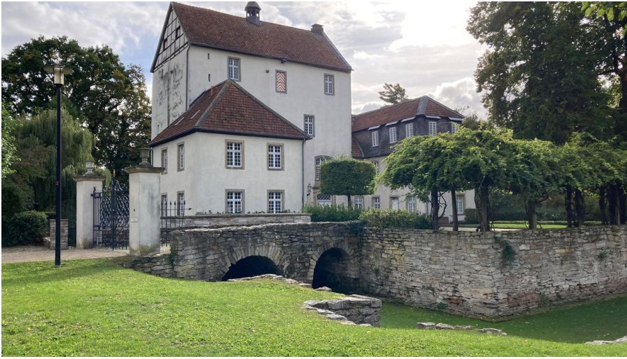
Dreckburg | Salzkotten