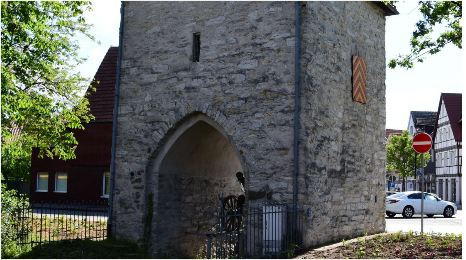
Westertor | Salzkotten