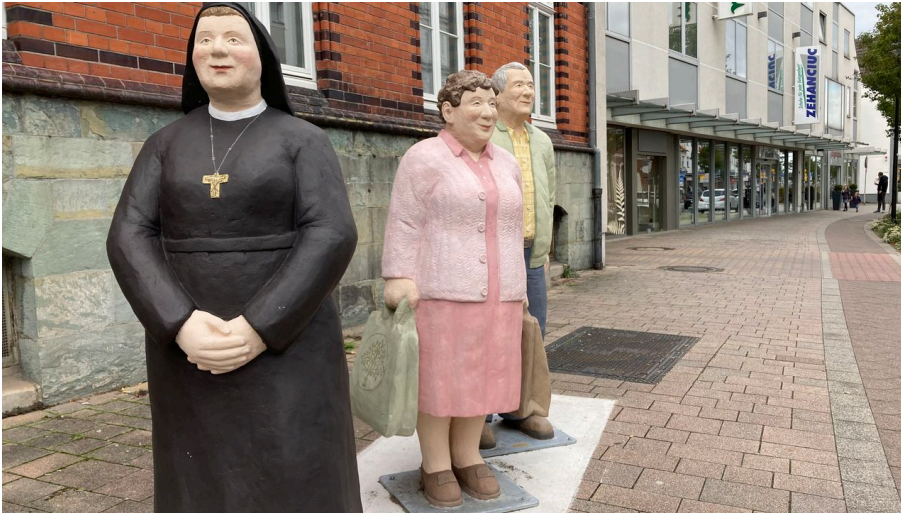
"Alltagsmenschen" am alten Postamt | Salzkotten