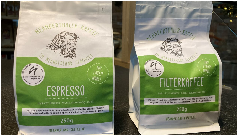
Neanderthal Kaffee aus der Kult-Kaffee Rösterei in Heiligenhaus