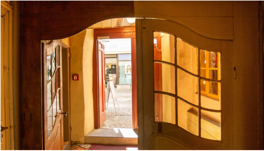
Museumshaus Stralsund Eingang