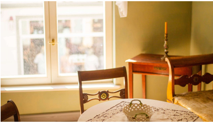
Museumshaus Stube