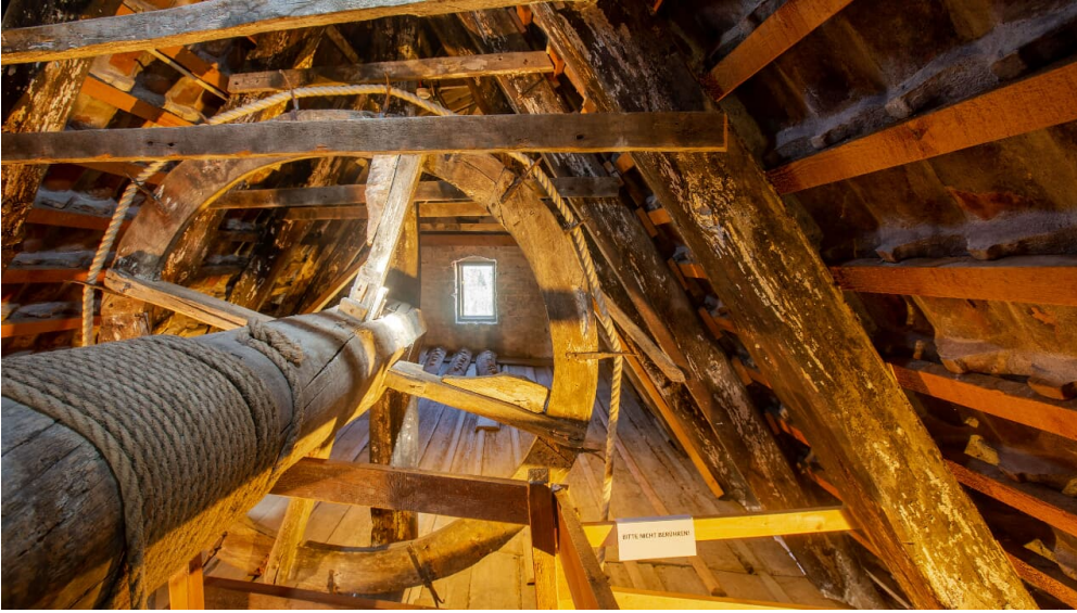
Museumshaus Stralsund Holzlastenrad