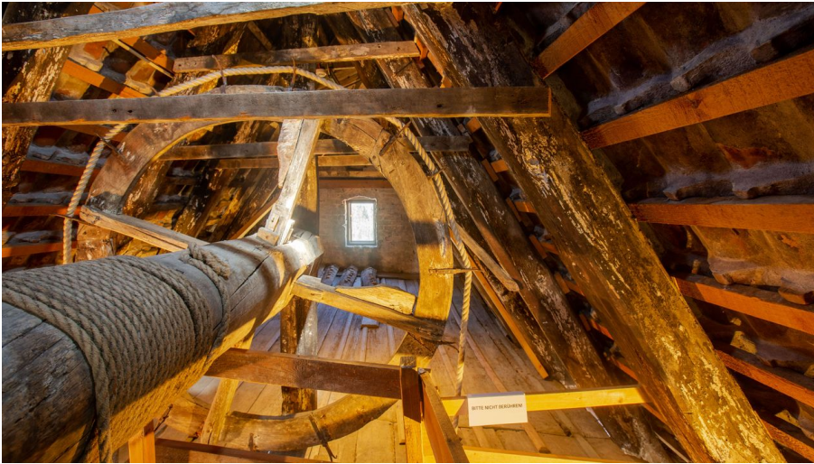
Museumshaus Stralsund Holzlastenrad