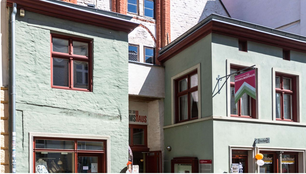
MuseumshausStralsundAußenansicht - © STRALSUND MUSEUM