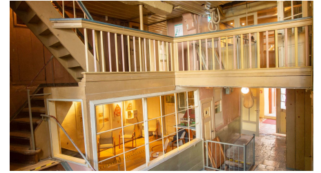
Museumshaus Diele