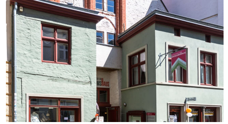
Museumshaus Stralsund Außenansicht