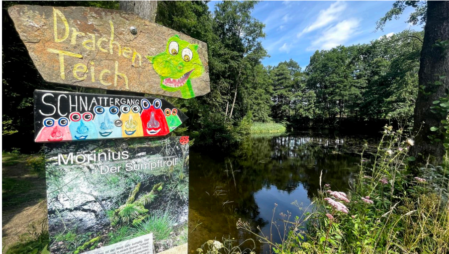
Drachenteich.jpg