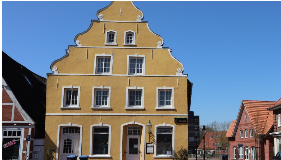
Gelbes Barockgiebelhaus Nordseebad Otterndorf