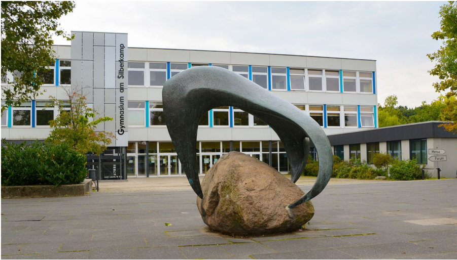
Die_Kralle_Peine (1).jpg