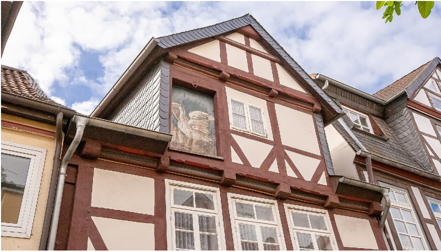
Pelikanhaus_Peine (1).jpg - - welcome@peinemarketing.de