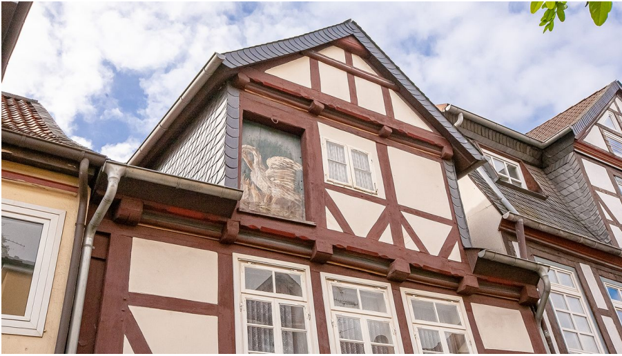
Pelikanhaus_Peine (1).jpg