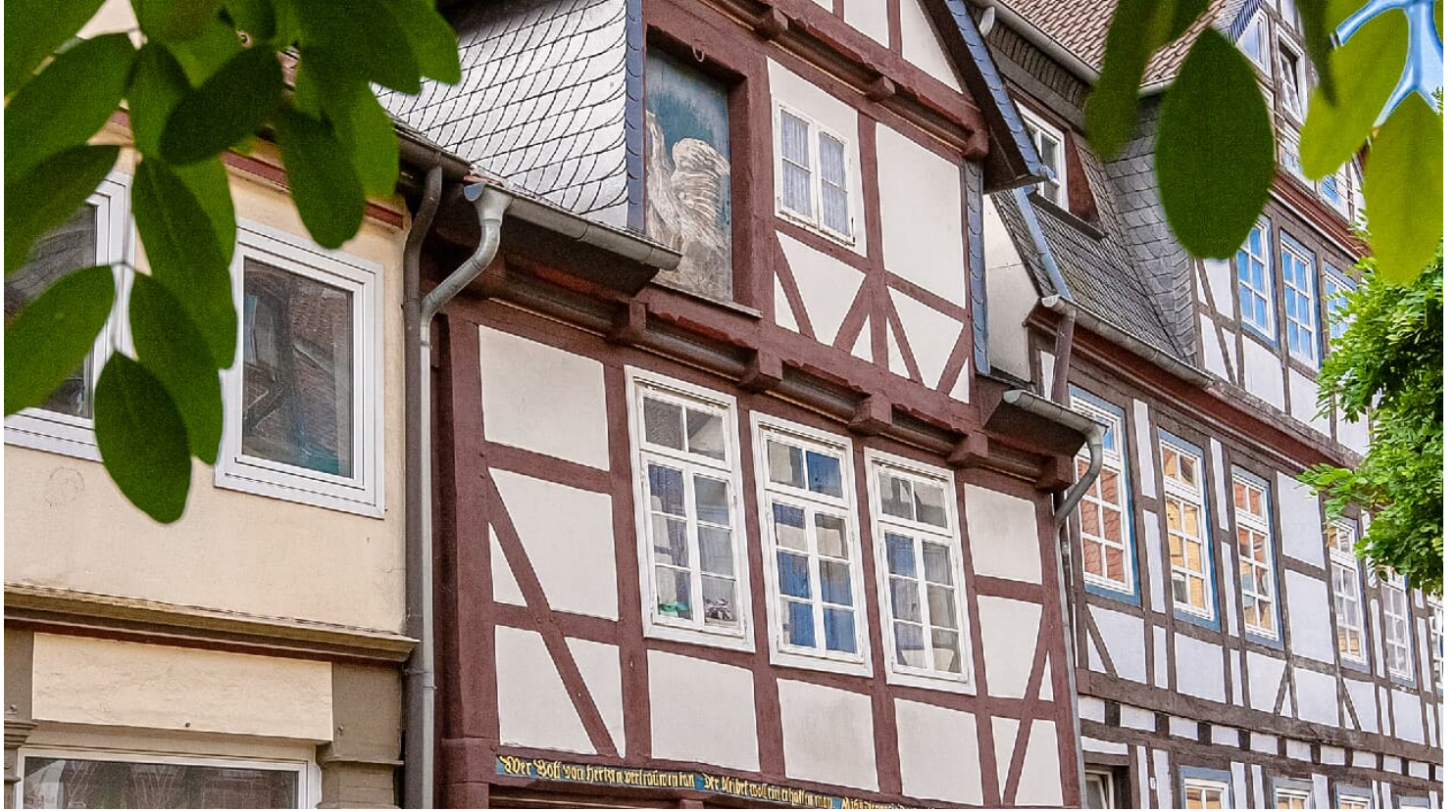
Pelikanhaus_Peine (2).jpg