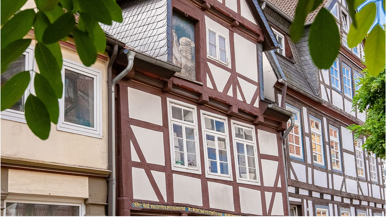
Pelikanhaus_Peine (2).jpg