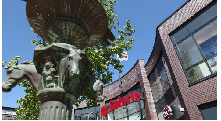
Pferdebrunnen2_©PeineMarketing.jpg · · welcome@peinemarketing.de