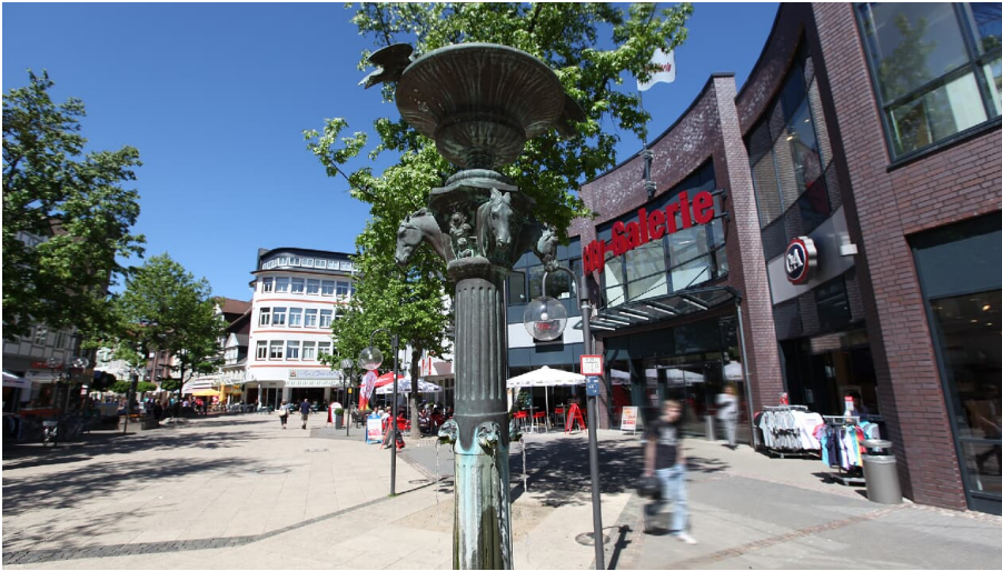
Pferdebrunnen4_@PeineMarketing.jpg - - welcome@peinemarketing.de