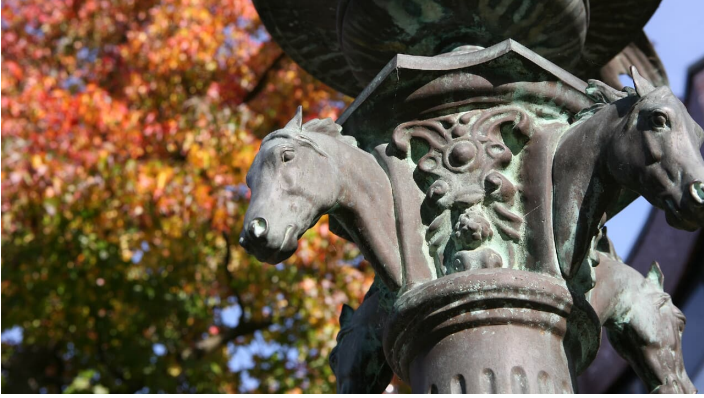
Pferdebrunnen1_©PeineMarketing.jpg · · welcome@peinemarketing.de