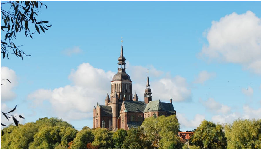
Marienkirche Stralsund