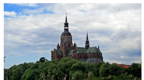
Marienkirche Stralsund