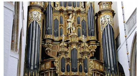
Marienkirche Orgel - © TMV