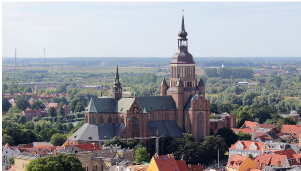
Marienkirche Stralsund

----- Ab März Sonntags um 10.00 Uhr feiern wir in unserer Kirche Gottesdienst. Wir bitten um Verständnis, dass die Kirche an Sonn- und Feiertagen während der Gottesdienste und zu Andachten nicht besichtigt werden kann. Alle Besucher, die an unseren Gottesdiensten teilnehmen möchten, sind herzlich dazu eingeladen.