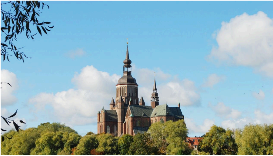
Marienkirche Stralsund