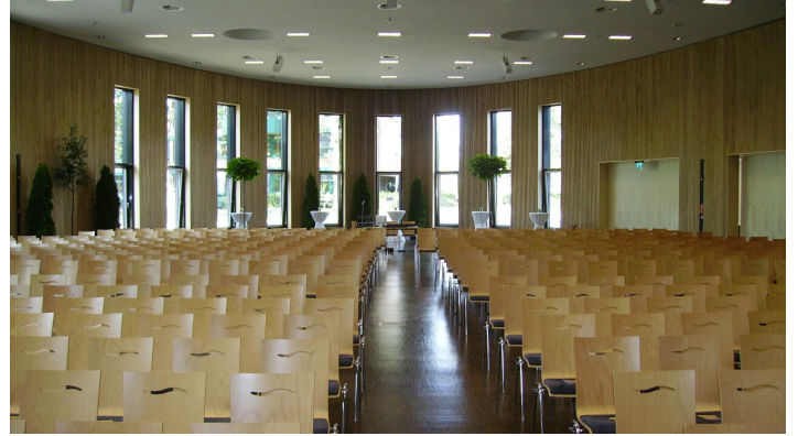
Aula_SHS_CC-BY-SA_Teutoburger_Wald_Stadt_Schloss_Holte-Stukenbrock (2).jpg