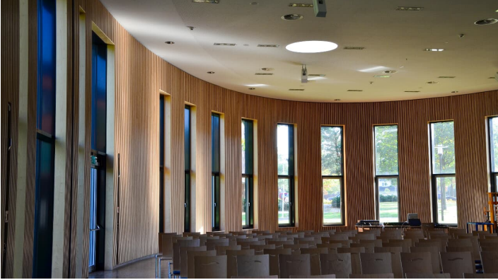
Aula des Gymnasiums am Bürgerpark in Schloß Holte-Stukenbrock - © Teutoburger_Wald_Stadt_Schloss_Holte-Stukenbrock, Stadt Schloß Holte-Stukenbrock