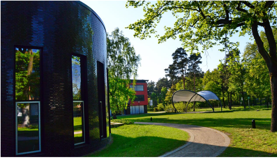
Aula am Gymnasium am Bürgerpark in Schloß Holte-Stukenbrock