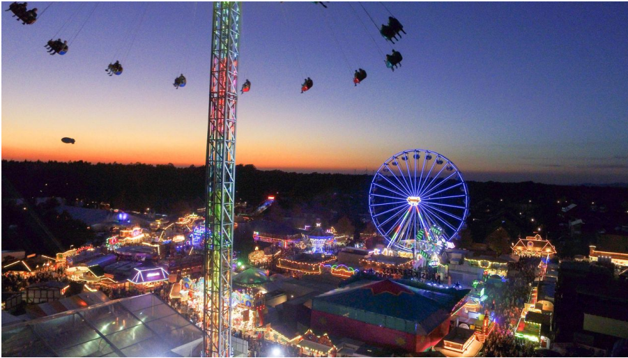
Pollhans-Markt Schloß Holte im Abendlicht