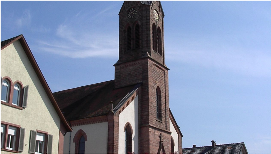
Kirche St Roman