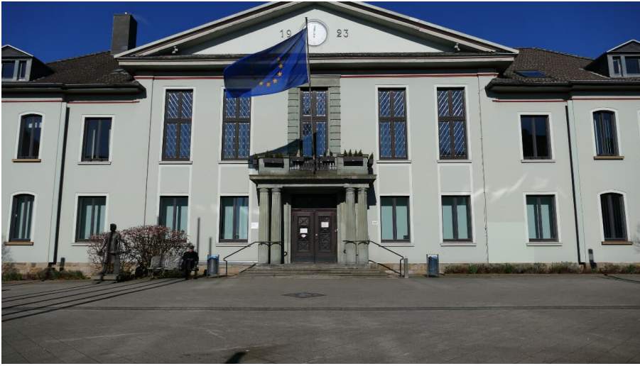
Rathaus in Heiligenhaus