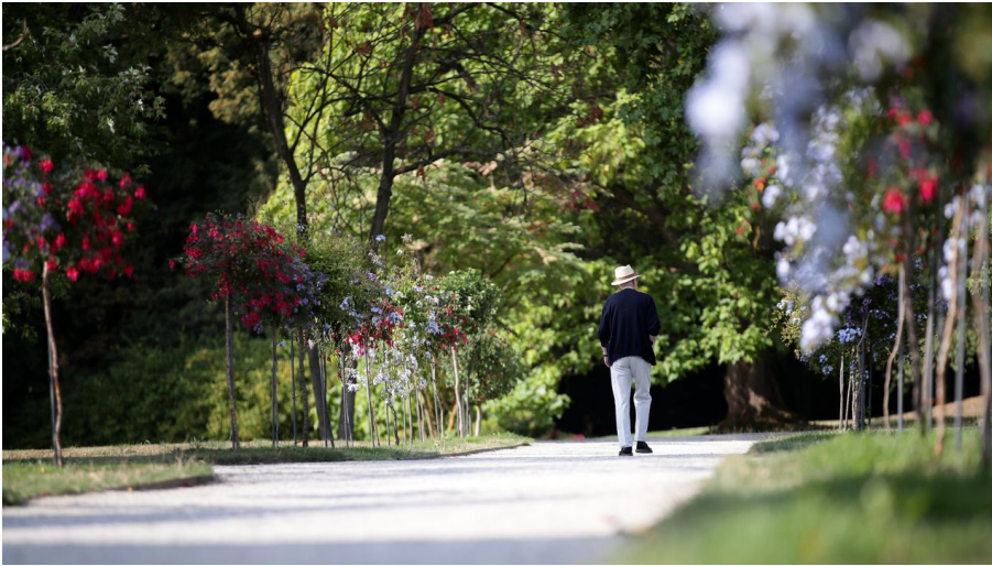
Kassel-Bad Wilhelmshöhe - Wilhelmshöhe Park