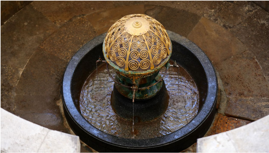
003HR - Bad Nauheim - Trinkuranlage Kurbrunnen.JPG