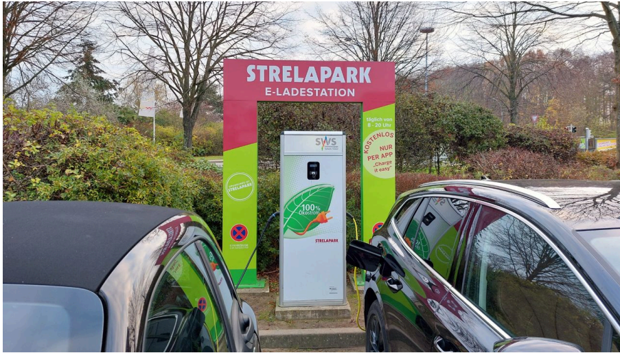
E-Auto-Ladestation STRELAPARK