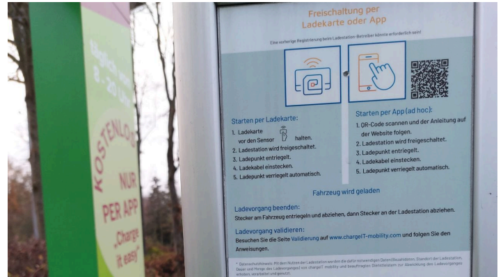
E-Auto-Ladestation STRELAPARK