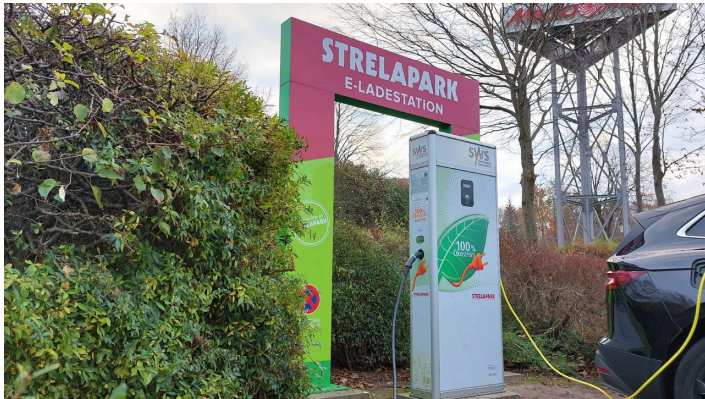
E-Auto-Ladestation STRELAPARK