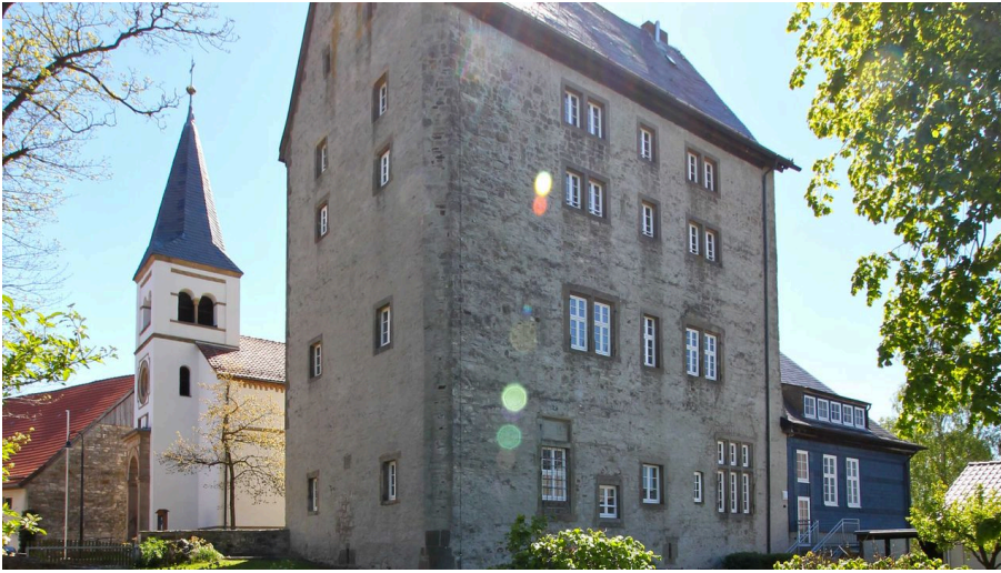
Burg Lichtenau