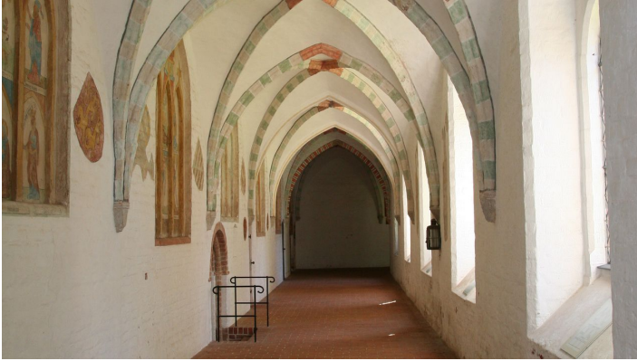
Ratzeburger Dom innen IMG_5296.JPG