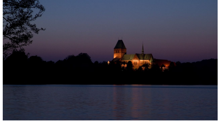
Der Ratzeburger Dom bei Nacht, Jens Butz.jpg - © Jens Butz