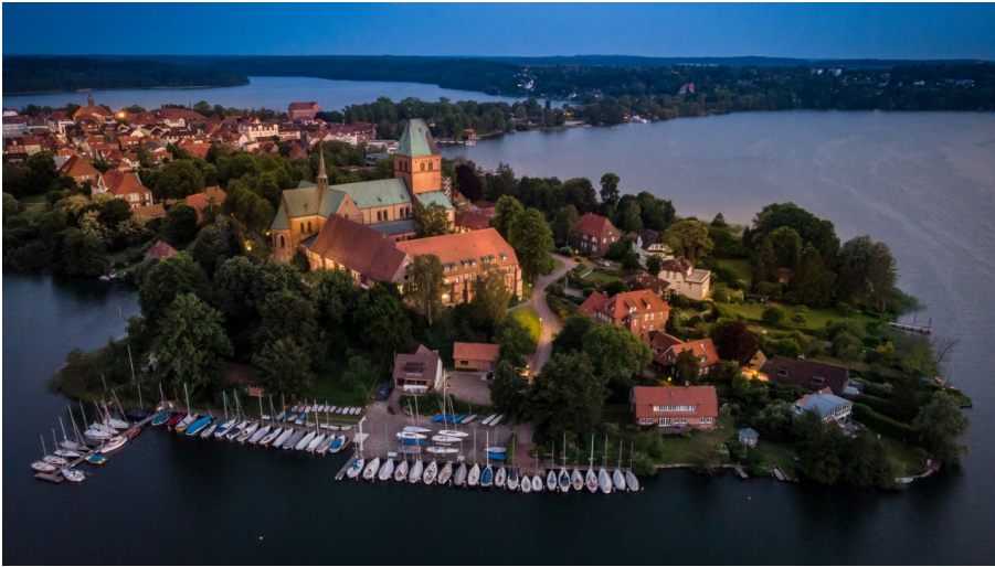
Abendstimmung über der Domhalbinsel