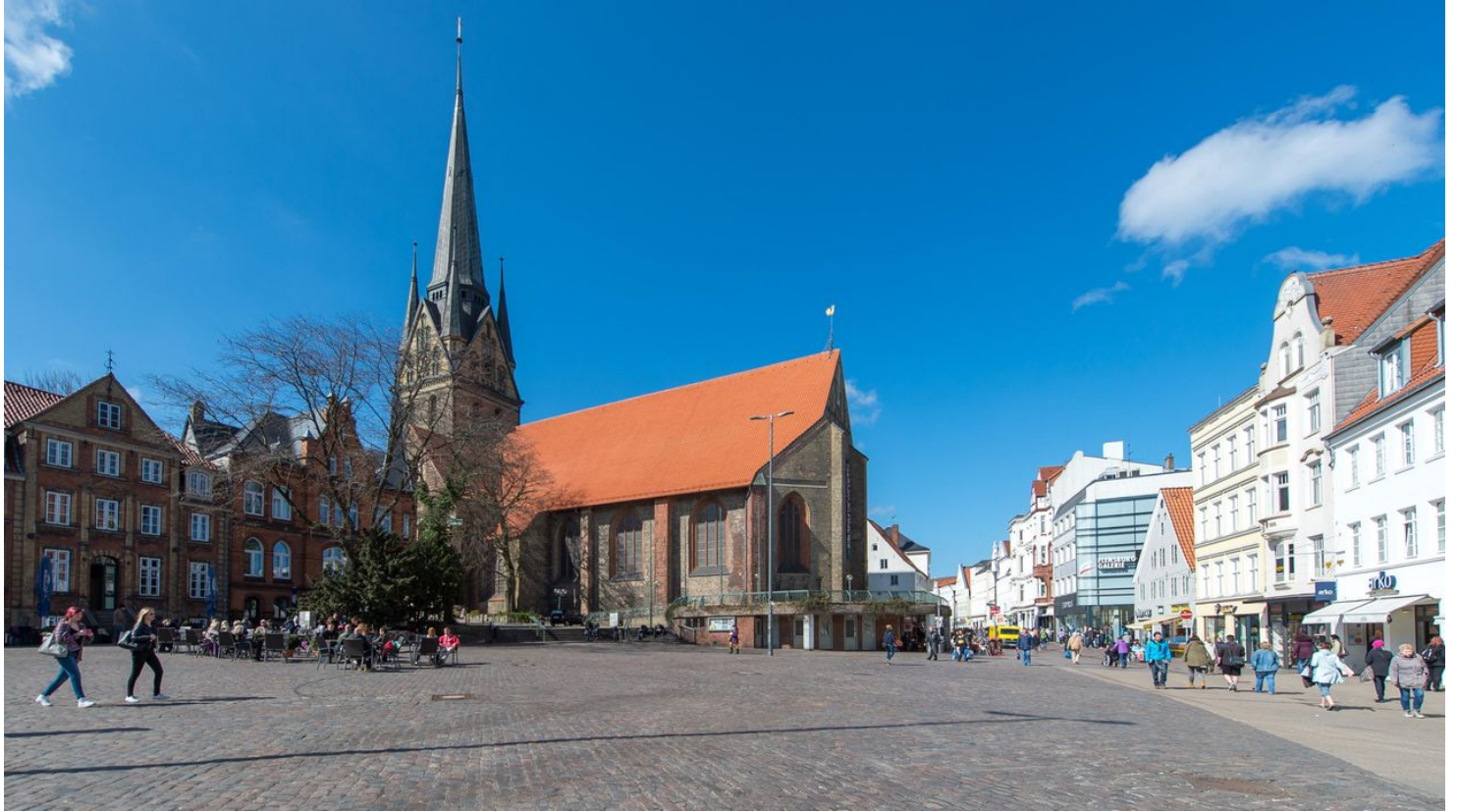
Südermarkt mit St. Nikolai