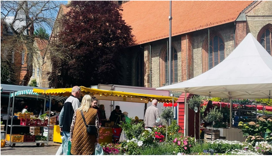
Wochenmarkt am Südermarkt