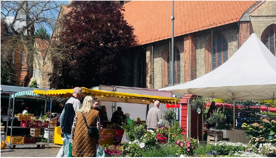
Wochenmarkt am Südermarkt