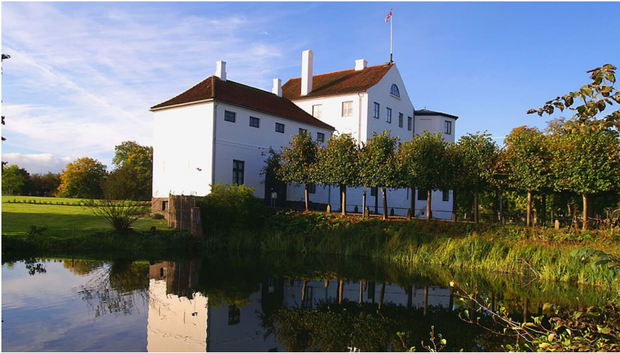
brundlund slot