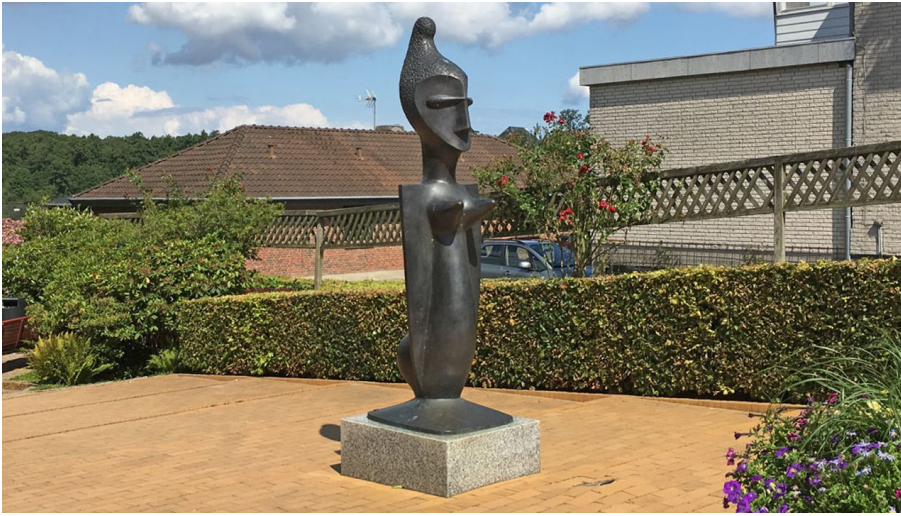
Dronningen-af-H.K.H.-Prins-Henrik

Das royale Kunstwerk Dronningen (die Königin) wurde ursprünglich als ein Schach Brick hergestellt von seinen K.H. Prinz Henrik (1934-2018). Das Schachspiel war ein Geschenk an sein Sohn der damalige Kronprinz Frederik zu seinen 20-sigsten Geburtstag. Seit 14. Januar 2024, König Frederik X von Dänemark.