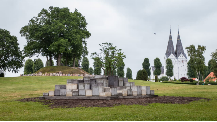
Grænselandets-Mosaik ved Broager-Kirke - © Kim Toft Jørgensen, Kim Toft Jørgensen/Sønderborg Kommune