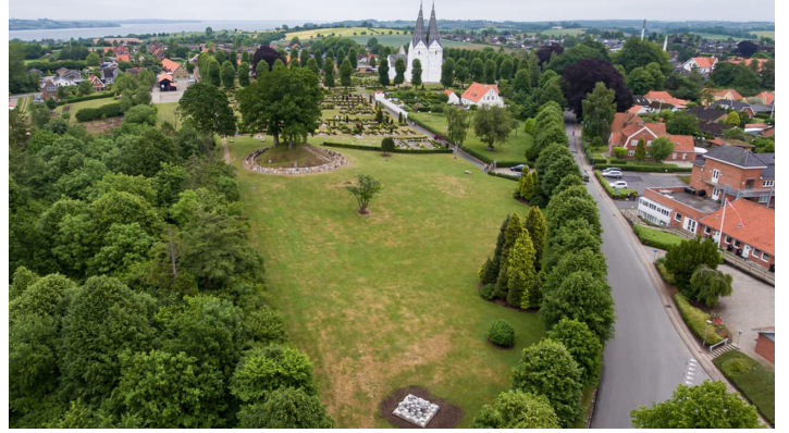
Grænselandets-Mosaik i forhold til Broager-Kirke