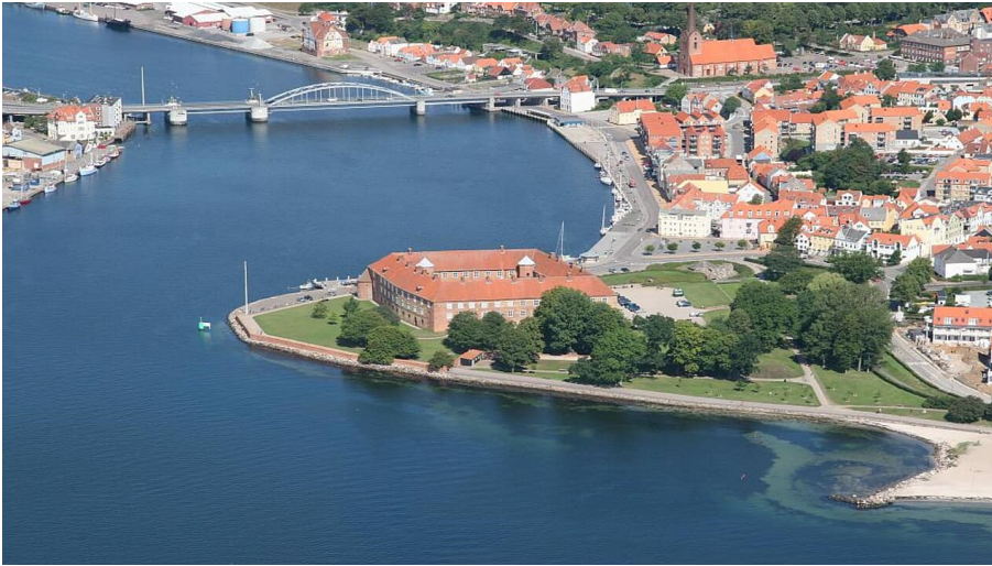
Sønderborg Slot